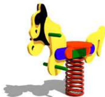
Rysunek 6 Przykładowe zdjęcie

czerwony, żółty niebieski, pomarańczowy, mahoń, zieleń (barwy ciepłe).