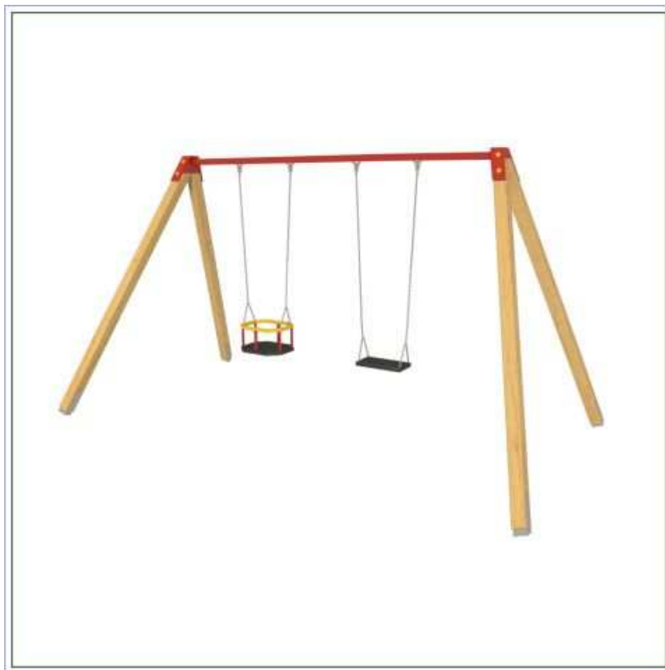
Rysunek 2 Przykładowe zdjęcie

Wykonawca ma obowiązek zachować odpowiednią strefę bezpieczeństwa dla oferowanego urządzenia.