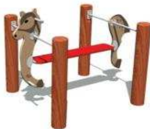
Rysunek 4 Przykładowe zdjęcie

Wykonawca ma obowiązek zachować odpowiednią strefę bezpieczeństwa dla oferowanego urządzenia.