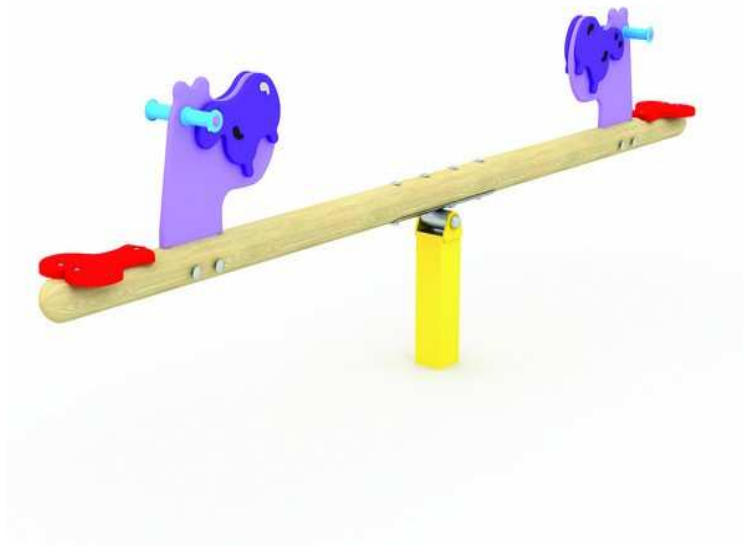
Rysunek 3 Przykładowe zdjęcie

Wykonawca ma obowiązek zachować odpowiednią strefę bezpieczeństwa dla oferowanego urządzenia.