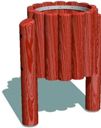
Rysunek 9 Przykładowe zdjęcie