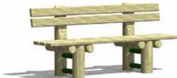
Rysunek 8 Przykładowe zdjęcie