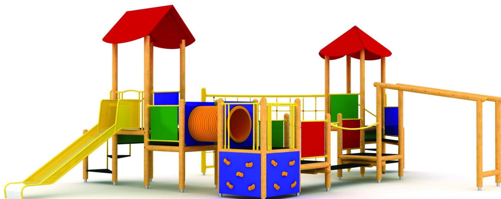
Rysunek 1 Przykładowe zdjęcie

Wykonawca ma obowiązek zachować odpowiednią strefę bezpieczeństwa dla oferowanego urządzenia.