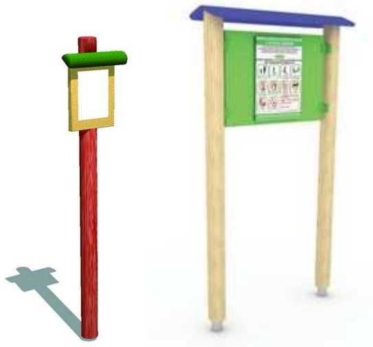
Rysunek 10 Przykładowe zdjęcia