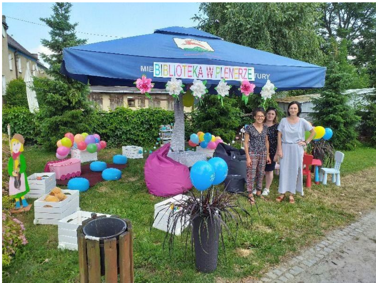
Biblioteka w plenerze Czerwiec 2019

Księgozbiór biblioteki liczy ok. 30807 woluminów. Z księgozbiorów biblioteki i filii korzysta 820 czytelników ( dane na dzień 31/12/2019). Zbiory biblioteki to książki z literatury pięknej polskiej i obcej (w tym klasyka i powieści współczesne – romanse, kryminały, powieści obyczajowe, sensacyjne, fantastyka, poezja, dramaty, lektury szkolne), literatura dla dzieci i młodzieży, wydawnictwa popularno-naukowe z wszystkich dziedzin wiedzy, 10 tytułów czasopism oraz audiobooki, które wzbogacają księgozbiór biblioteki jako zbiory specjalne.