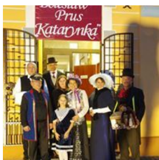
Narodowe Czytanie Wrzesień 2019