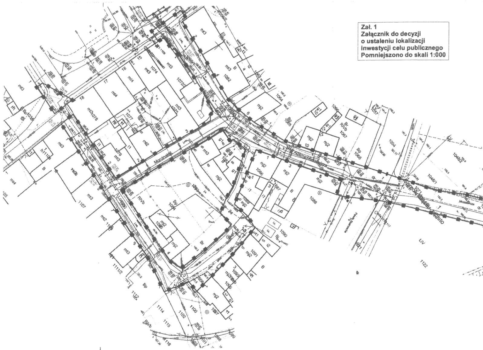
Zał. 1 Załącznik do decyzji o ustaleniu lokalizacji inwestycji celu publicznego Pomniejszono do skali 1:000