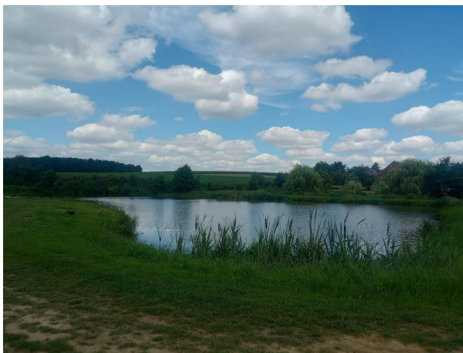
Rysunek 10 Zbiornik w Gołej "Ostoja nad Stawem"