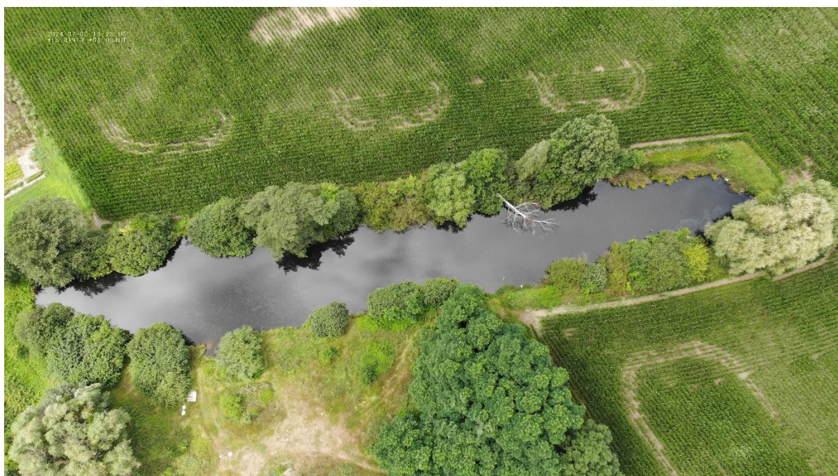
Rysunek 3 Zbiornik RÓW BOISKO – widok z drona

Miejsce nie nadaje się do kąpieli czy plażowania, ze względu na zamulenie dna oraz utrudniony, dostęp do linii brzegowej — znacząco porośnięty roślinnością brzegową. Zbiornik o głębokości do 4 m. usytuowany za boiskiem sportowym. Dojazd do zbiornika drogą polną. Teren oznakowany.