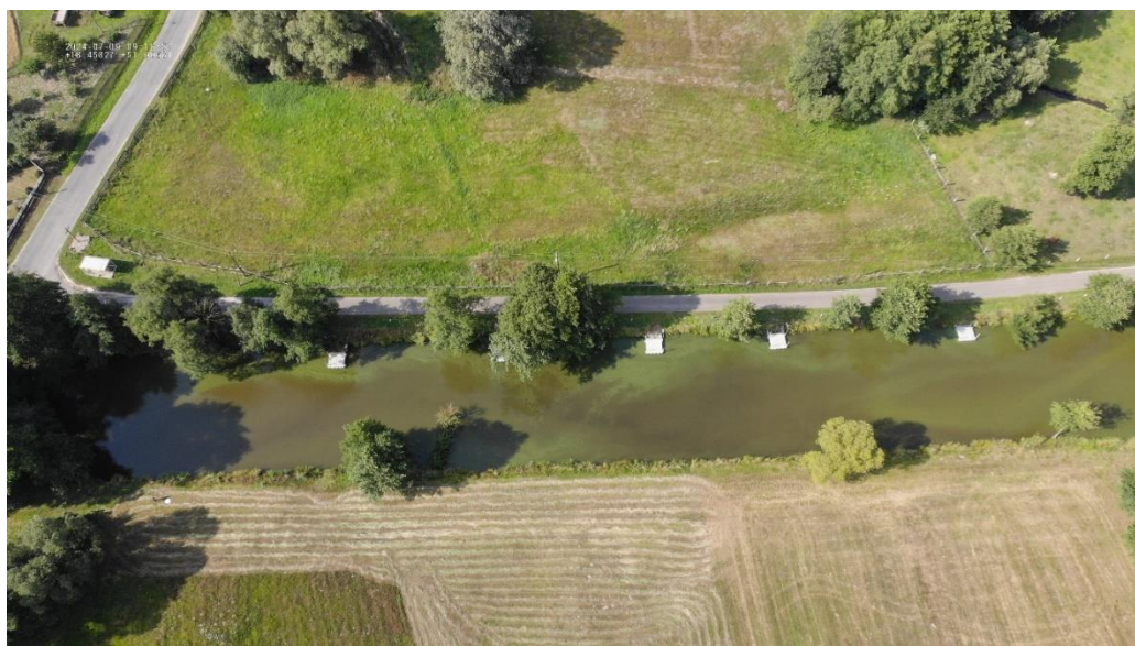
Rysunek 8 Zbiornik RÓW JASTRZYGOWICE - widok z drona