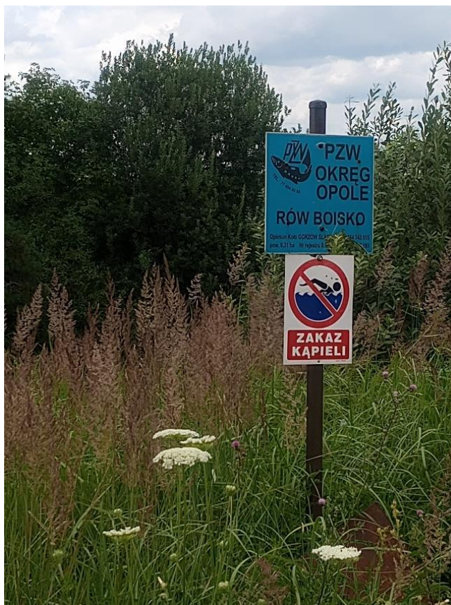
Rysunek 4 Zbiornik RÓW BOJSKO