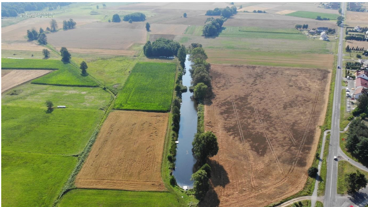
Rysunek 6 Zbiornik STAW RAJMAN-widok z drona.