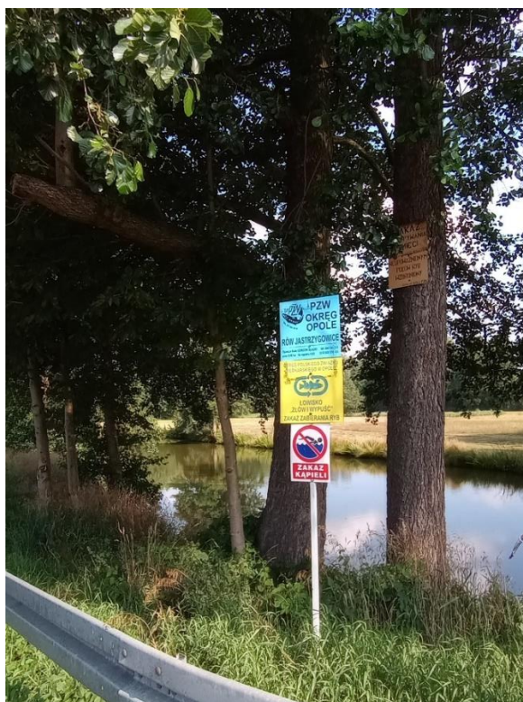
Rysunek 7 Zbiornik RÓW JASTRZYGOWICE

Zbiornik wodny o powierzchni 0,3 ha zlokalizowany na działce nr 33 obręb Jastrzygowice. Zbiornik użytkowany jest przez Polski Związek Wędkarski. Dzierżawa zawarta na okres od dnia 1.05.2022 r. do dnia 30.04.2032 r. Zbiornik o głębokości do 2,5 m. z mulistym dnem jest ogólnodostępny, nieogrodzony, oznakowany. Zbiornik okalają tereny prywatne z przeznaczeniem pod uprawy rolne. Zbiornik służy również do celów przeciwpożarowych.