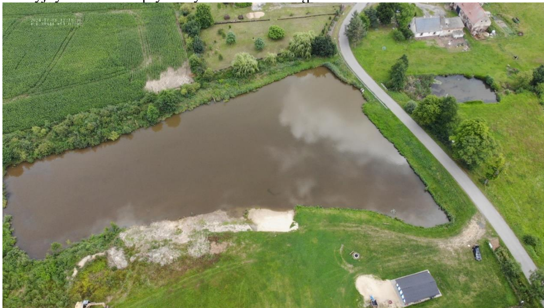
Rysunek 9 Zbiornik w Gołej "Ostoja nad Stawem" - widok z drona

Zbiornik w miejscowości Goła na działce nr 21/1 przy drodze powiatowej nr 1905O o powierzchni 0,8 ha, znajduje się na terenie prywatnym, wykorzystywany przede wszystkim jako zbiornik rekreacyjny. Zbiornik jest nieogrodzony i nieoznakowany tablicami informacyjnymi o terenie prywatnym i zakazie wstępu.