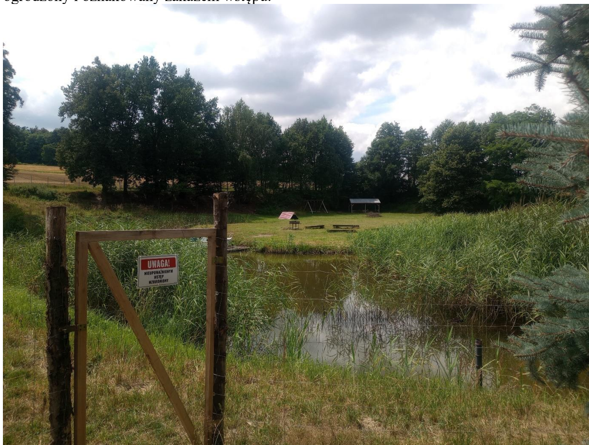
Rysunek 11 Zbiornik w Uszycach Gospodarstwo Agroturystyczne „na Górcie”

Zbiornik usytuowany jest w miejscowości Uszyce, na działce nr 1101 o powierzchni 0,1 ha na terenie prywatnym. Zbiornik wykorzystywany jest na cele agroturystyki. Teren zbiornika jest ogrodzony i oznakowany zakazem wstępu.