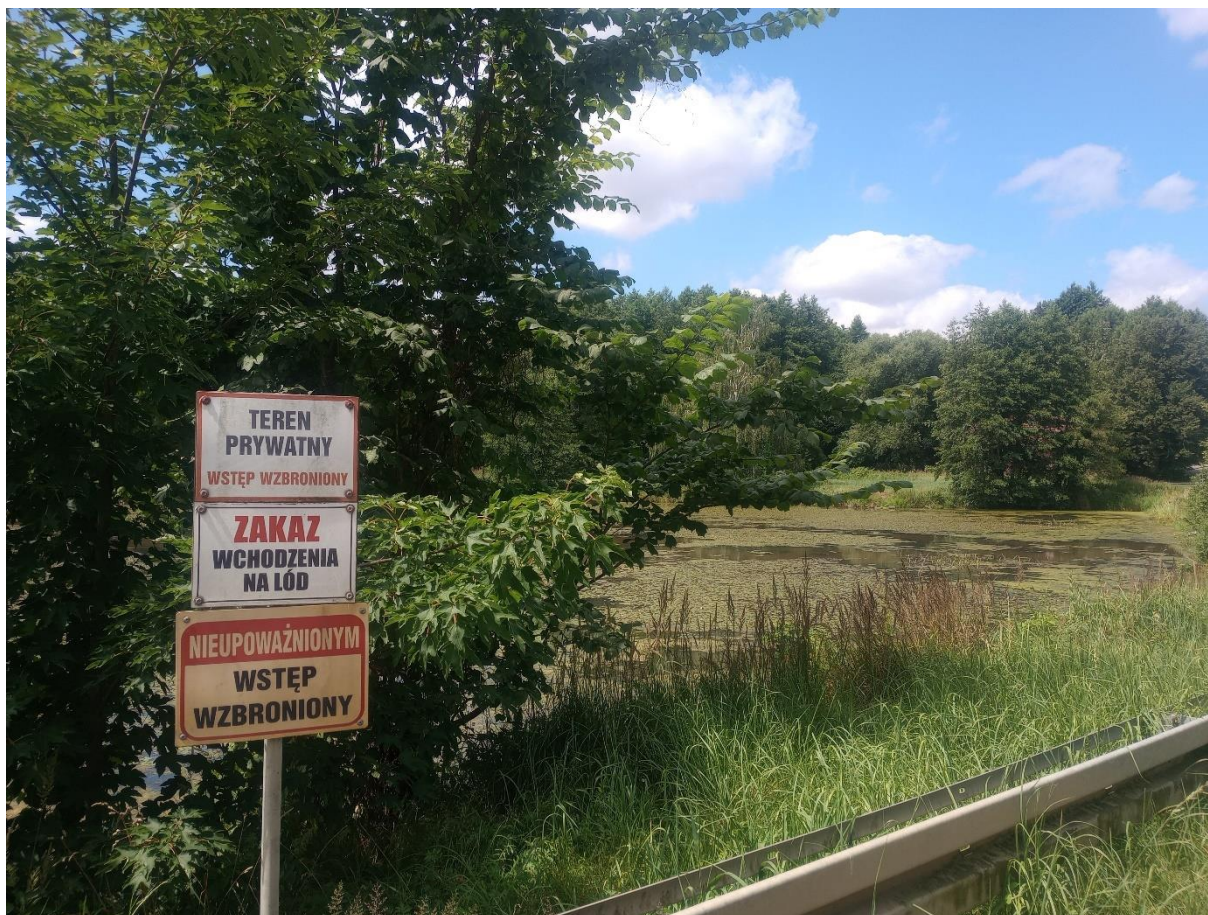
Rysunek 12 Zbiornik w Zdziechowicach

W miejscowości Zdziechowice przy drodze powiatowej nr 8608 O na działkach Nr 953, 477, 476 znajduje się zbiornik wodny. Przed wejściem na w/w obszar wodny właściciel umieścił tabliczki informujące o zakazach i własności terenu.