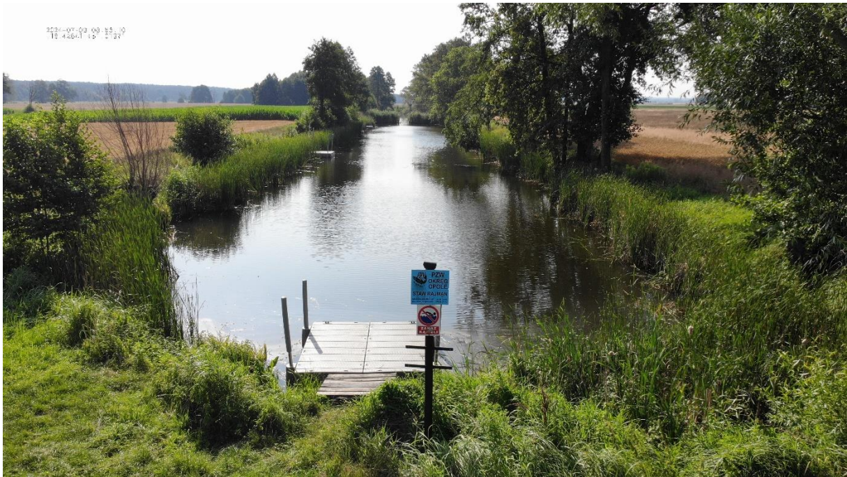
Rysunek 5 Zbiornika STAW RAJMAN- widok z drona