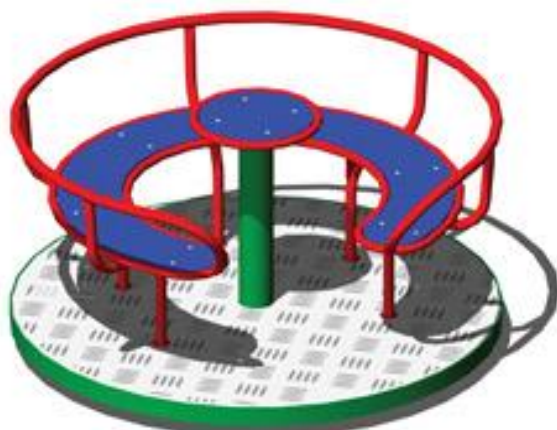
Rysunek 8 Przykładowe zdjęcie

Wykonawca ma obowiązek zachować odpowiednią strefę bezpieczeństwa dla oferowanego urządzenia.