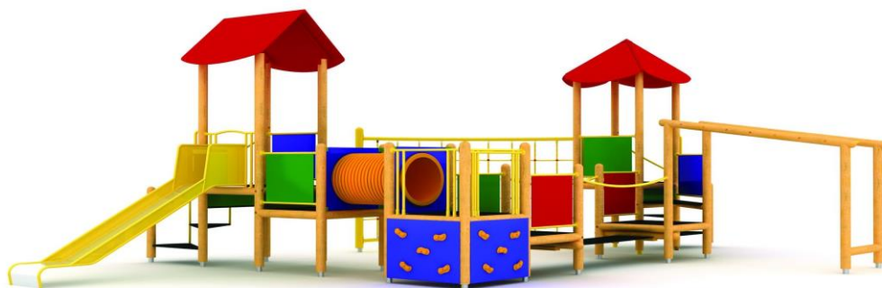
Rysunek 1 Przykładowe zdjęcie