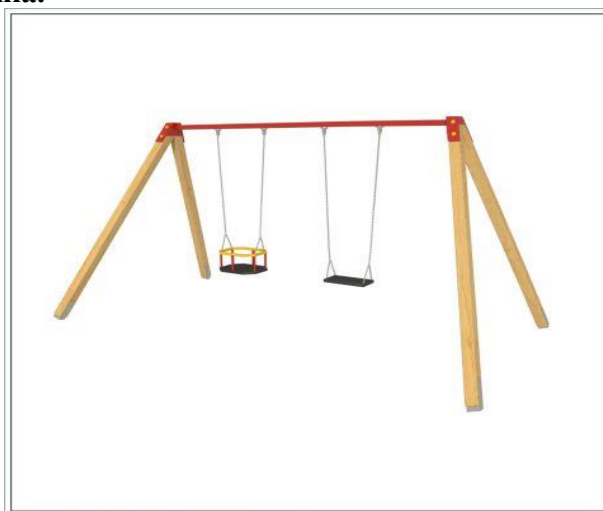
Rysunek 3 Przykładowe zdjęcie

Wykonawca ma obowiązek zachować odpowiednią strefę bezpieczeństwa dla oferowanego urządzenia.