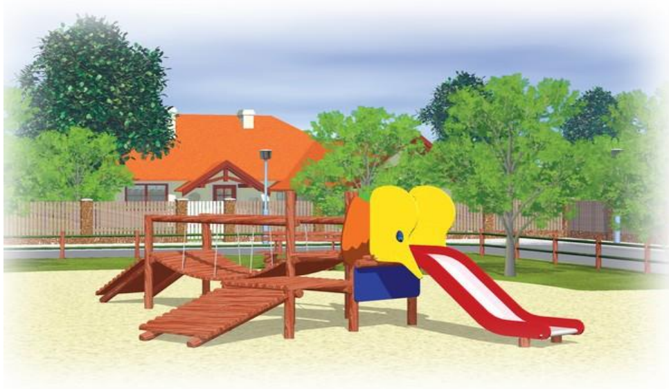
Rysunek 2 Przykładowe zdjęcie