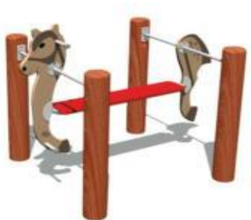
Rysunek 5 Przykładowe zdjęcie