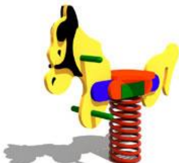
Rysunek 7 Przykładowe zdjęcie

Wykonawca ma obowiązek zachować odpowiednią strefę bezpieczeństwa dla oferowanego urządzenia.