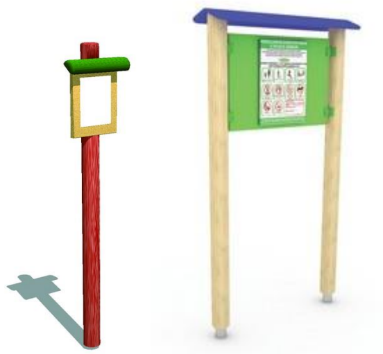
Rysunek 11 Przykładowe zdjęcie