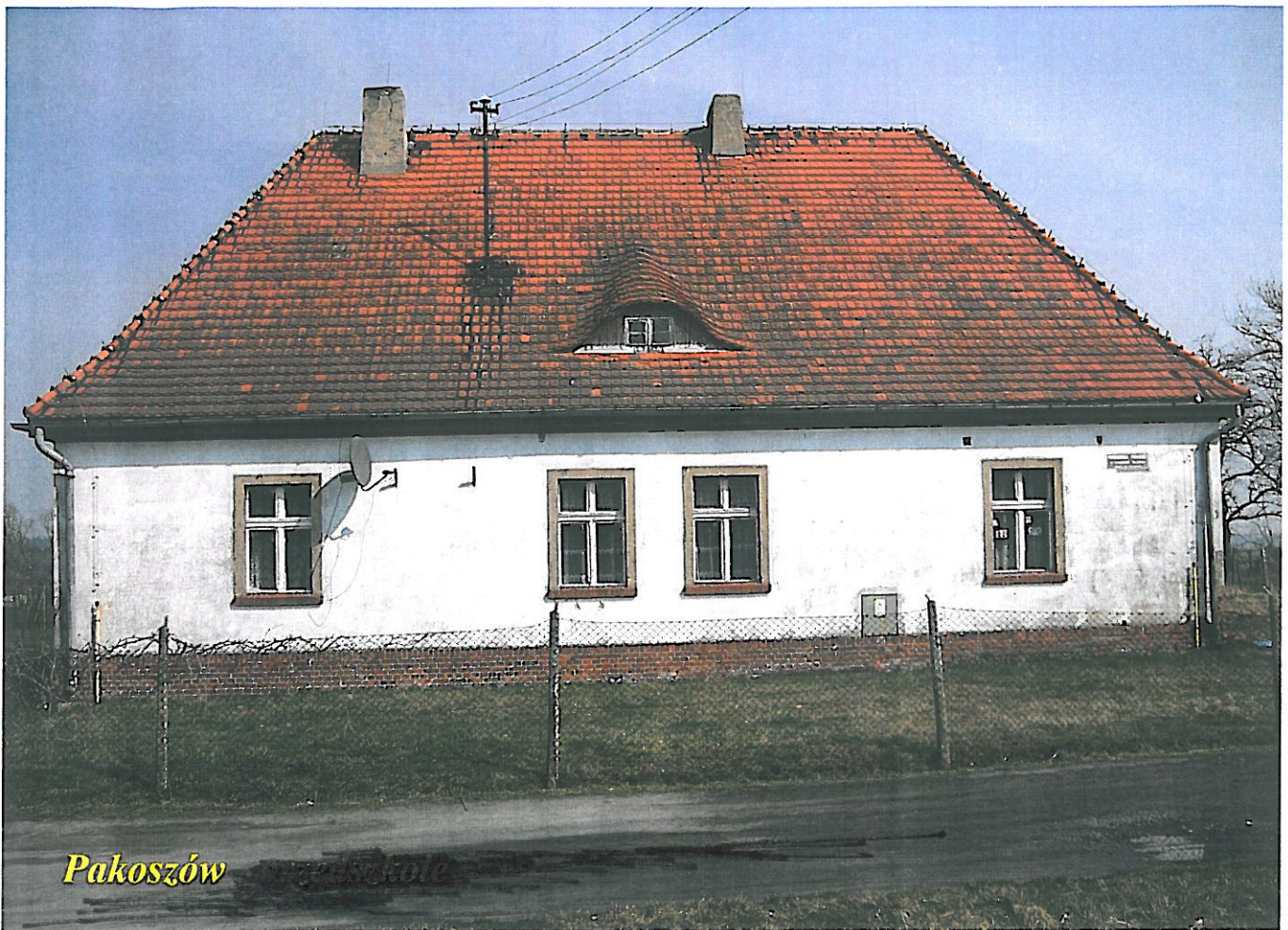
Pakoszów - przedszkole